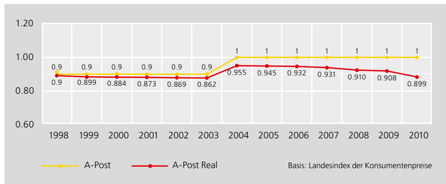
Grafik 2: Preisentwicklung A-Post 0–100 Gramm seit Postreform 1998 (in CHF)